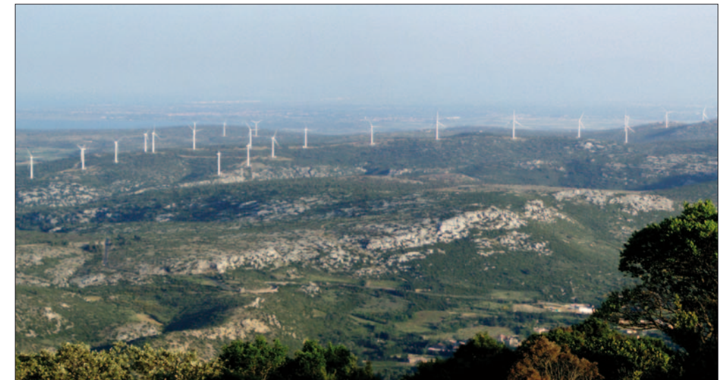
1. Parc éolien dans les Corbières, Aude et Pyrénées-Orientales, juin 2007 (Mathieu Bourgeois). Wind-farm in southern France.

Nicheur connu de longue date dans cette région, l'Aigle royal y atteint des densités assez importantes (jusqu'à un couple pour 175 km 2 ). Cette population est suivie depuis de nombreuses années par les ornithologues locaux. Les sites de reproduction sont identifiés et les limites des territoires de chaque couple globalement bien cernées. Historiquement, ces milieux méditerranéens sont plutôt le domaine de l'Aigle de Bonelli, mais