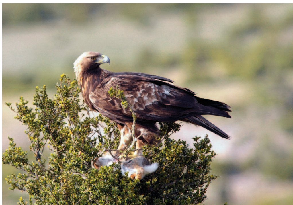
2. Aigle royal Aquila chrysaetos , adulte, Lozère, avril 2011 (Bruno Berthémy). Adult Golden Eagle.

La productivité moyenne des sites A et B est de 0,35 jeune par couple et par an sur l'ensemble de la période 1998 à 2014 (n = 17 années de reproduction) ; elle était de 1,33 sur le site A avant 2001 (n = 3), c'est-à-dire avant les travaux, de 0,66 sur