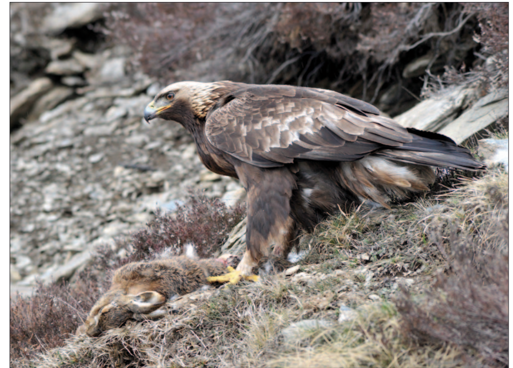
3. Aigle royal Aquila chrysaetos , adulte, Hautes-Pyrénées, avril 2010. Adult Golden Eagle .

• CLANZIG S. (1989). Pressions environnementales s'exerçant sur l'étang de Salses-Leucate: état des lieux. Documents du C.I.E.L. n°3. • FERNANDEZ C. (1993). Effect of the viral haemorrhagic pneumonia of the wild rabbit on the diet and breeding success of the Golden Eagle Aquila chrysaetos . Rev. Écol. (Terre et Vie) 48: 323-329.